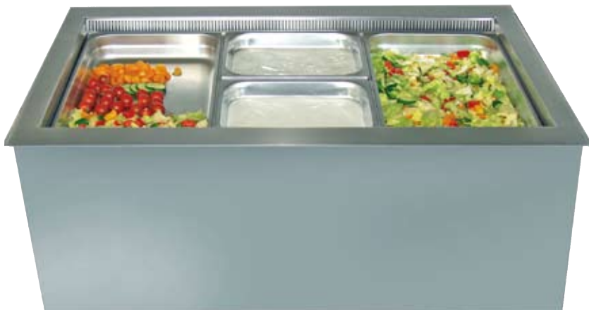
Modell „New Orleans“